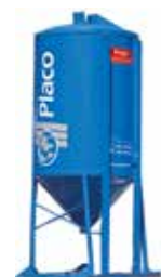
Silos (a granel)